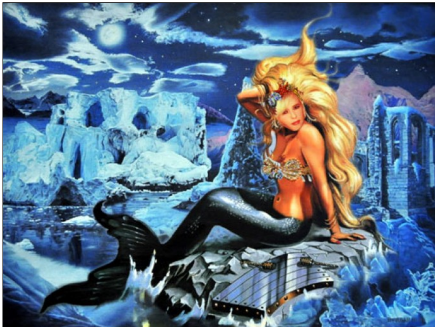
Artico, realizzato da Paola Franchi

computer: parto dalla foto del viso di una persona e gli creo intorno ambienti fantastici in cui proiettarla. Nell'ultimo lavoro Sirene , ad esempio, i personaggi diventano sirene e tritoni calati in un ambiente marino. Mi piace scavare nelle persone, conoscerle, per poi elaborare il loro fantastico. Mi sono sempre espressa con l'arte, ma i ritratti sono qualcosa di più: il ritratto è interiorizzazione, ed è collegato con ciò che ho vissuto: i drammi mi hanno dato molta più profondità e capacità di guardare gli altri. Io oggi mi piaccio più di ieri, anche grazie a ciò che mi è accaduto.